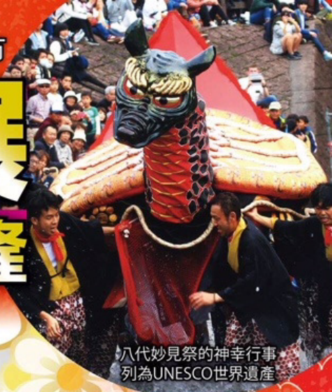
八代妙見祭的神幸行事 列為UNESCO世界遺產